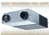
熱交換換気システム